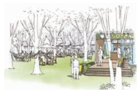
プロムナードの活用イメージ

今後、本構想を実現し、空間をより魅力的にしていくうえで、地域の関係主体のいっその連携・協働は不可欠です。今回のイベントも、利活用の実験の一つとして実施するもので、今後も地域の方々と協力しながら継続して利活用を図っていく予定です。