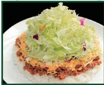
タコスマイル メキシコ料理