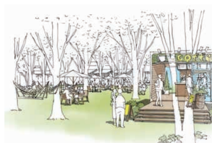
プロムナードの活用イメージ

今後、本構想を実現し、空間をより魅力的にしていくうえで、地域の関係主体のいっそうの連携・協働は不可欠です。今回のイベントも、利活用の実験の一つとして実施するもので、今後も地域の方々と協力しながら継続して利活用を図っていく予定です。