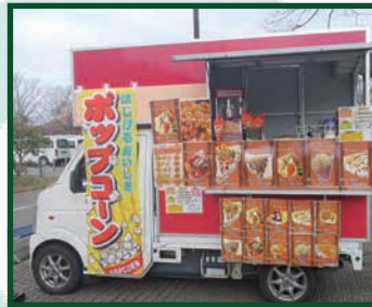
リコリコキッチン クレープ