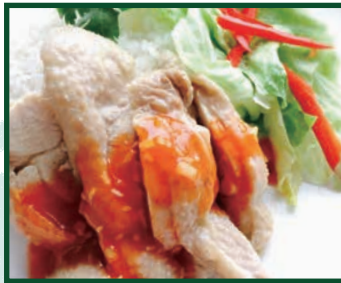
SK ガレージ チキンライス他