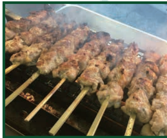
Little Kitchen Soleil 串焼き